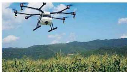
L'uso dei droni in agricoltura