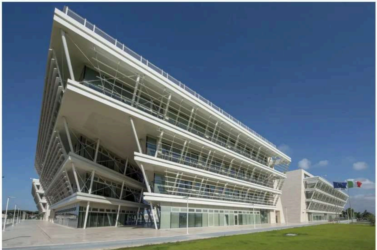
Il Rettorato dell'Università Roma Tor Vergata