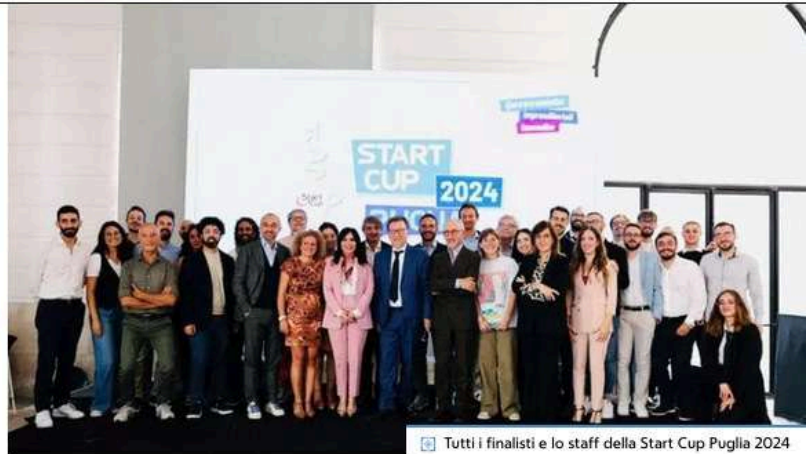
Tutti i finalisti e lo staff della Start Cup Puglia 2024

NeoGeo, lo studio di ingegneria naturalistica che contrasta l'erosione costiera si aggiudica la menzione speciale Green&Blue: miglior progetto contro il cambiamento climatico. I vincitori alla finale a Roma