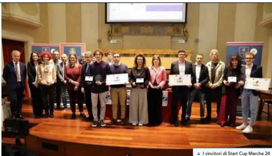
▲ I vincitori di Start Cup Marche 24

I team si preparano per partecipare alla finalissima del Premio Nazionale per l'Innovazione in scena all'Università degli Studi di Roma Tor Vergata a partire dal 5 dicembre